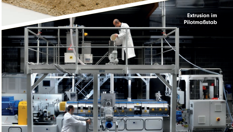
Extrusion im Pilotmaßstab